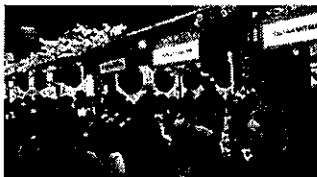
スマイルサポーターの活躍