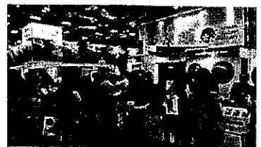
蟹キャップで鳥取県のPR