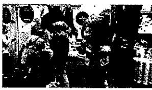
コナン、鬼太郎の登場