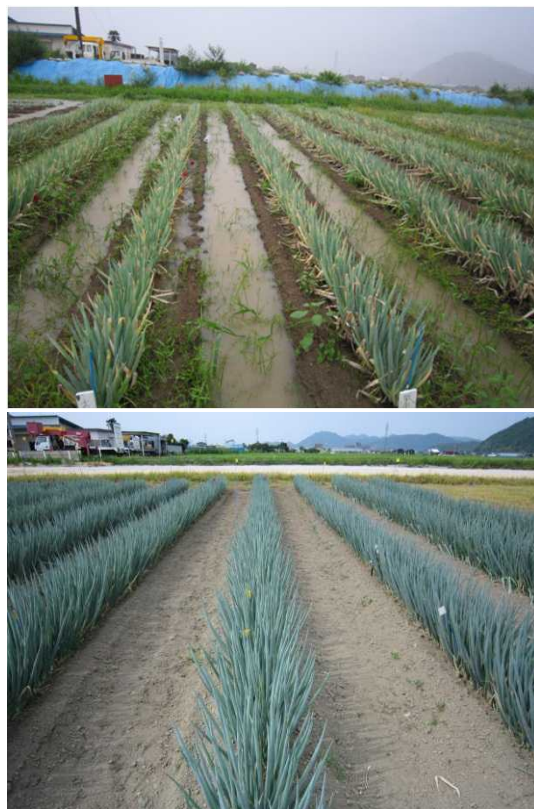
写真上 試験ほ場(降雨後の排水不良) 写真下 夏季の生育状況(2011年8月)