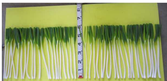
写真 夏扇パワー(調製後)