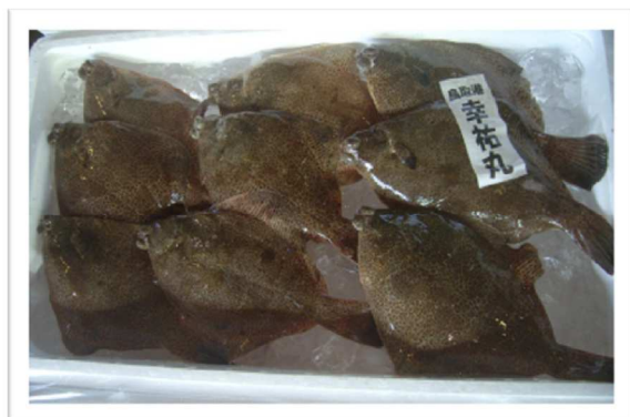
メイタガレイ (ホンメタ)