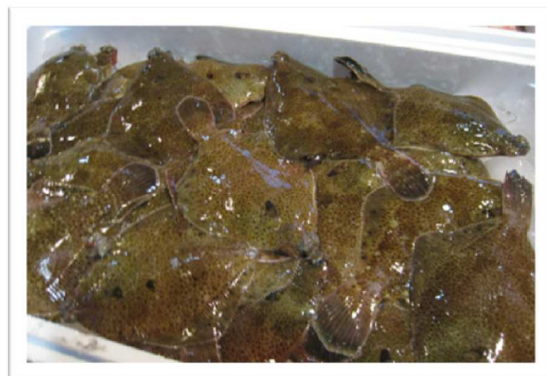
ナガレメイタガレイ (バケメタ)