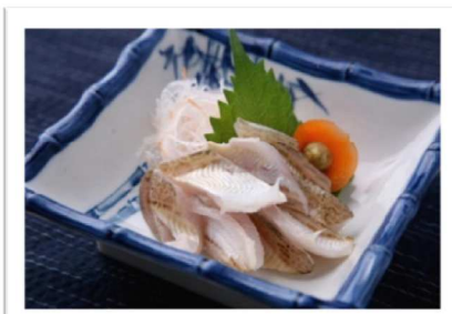
皮ごと食べる「湯びき」