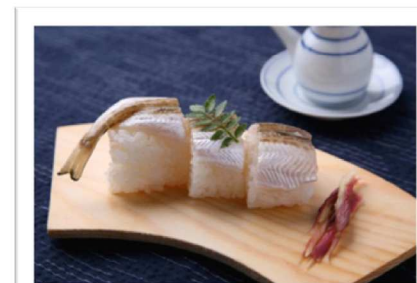
棒寿司状に一工夫。にぎり寿司もなかなかのもの