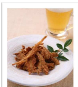
取り除いた背骨は「骨せんべい」でどうそ