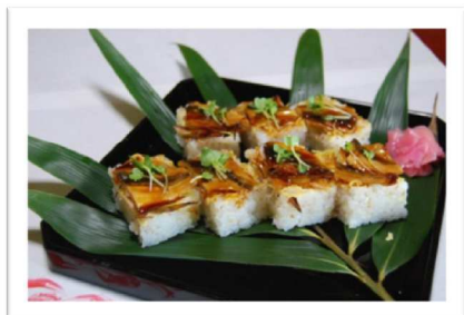
小型個体（ジンタン）を使った「じんたん寿司」