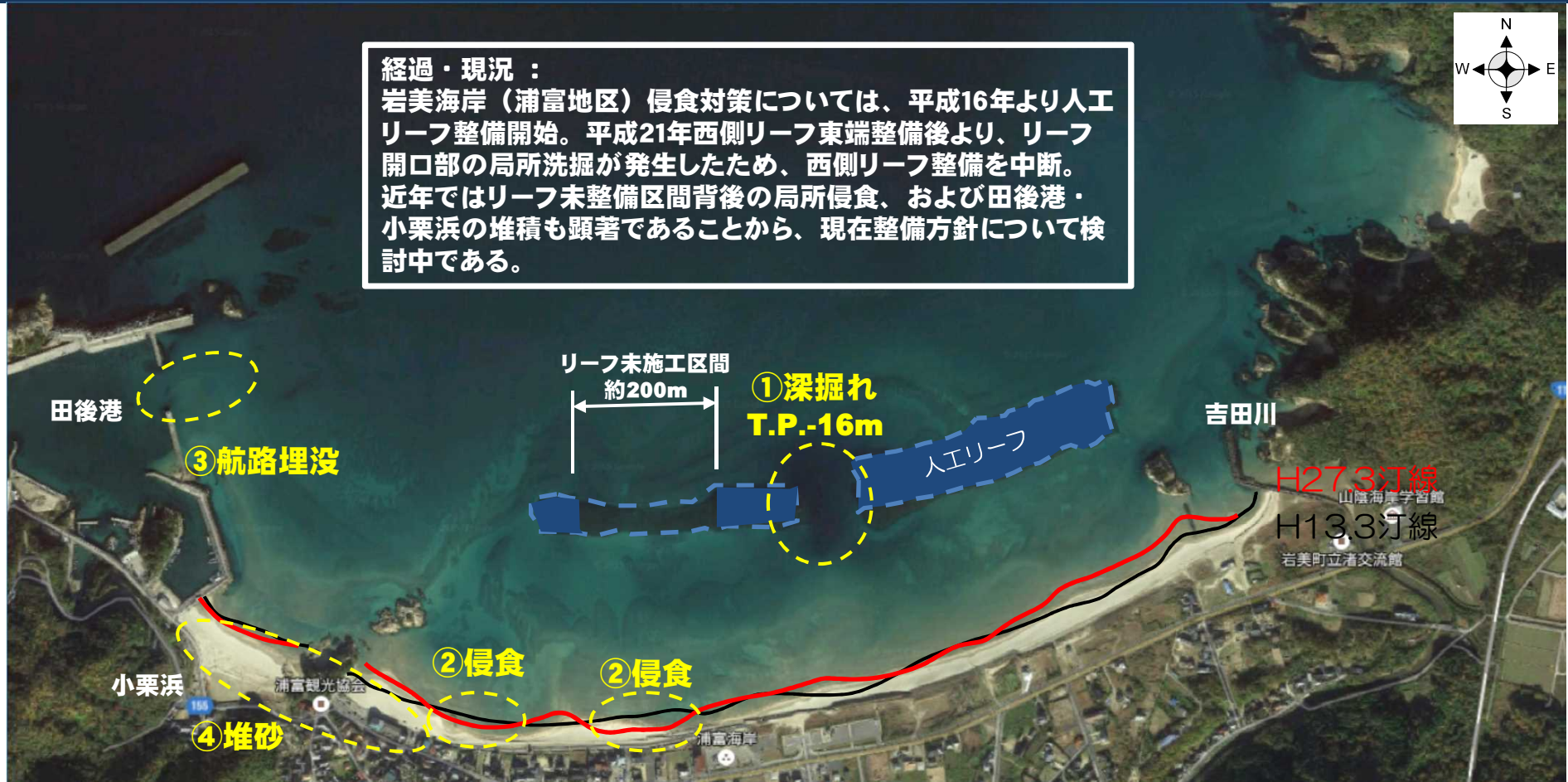
人工リーフ整備経緯

岩美海岸（浦富地区）侵食対策については、平成16年より人工リーフ整備開始。平成21年西側リーフ東端整備後より、リーフ開口部の局所洗掘が発生したため、西側リーフ整備を中断。近年ではリーフ未整備区間背後の局所侵食、および田後港・小栗浜の堆積も顕著であることから、現在整備方針について検討中である。