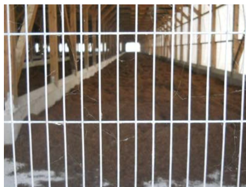
幅の狭い金網で小型鳥類の侵入を防止している例