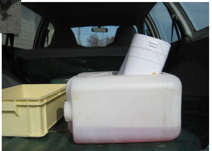
長靴用消毒容器の車載例