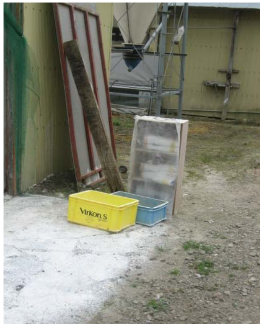
衛生管理区域及び家きん舎専用の衣服(白衣)と長靴の設置例