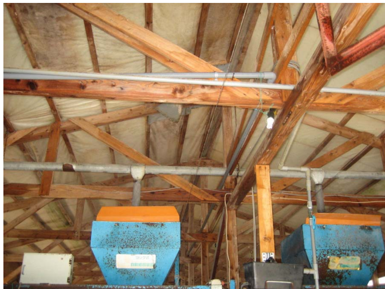
清掃が行き届いた家きん舎の例