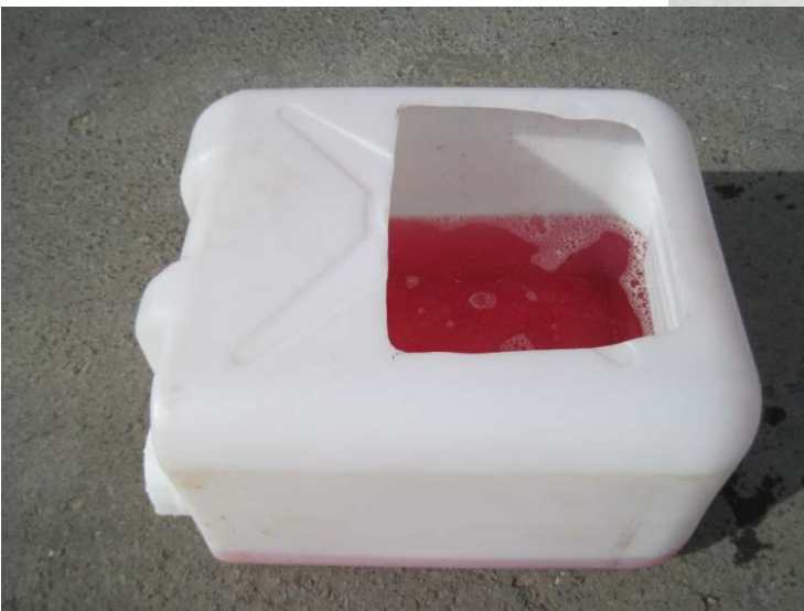
ポリタンクを改良した長靴用消毒容器