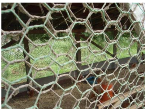
網目2cm以上のネットを二重にしている例

A. 屋外の運動場も含め、飼養する区域全てを防鳥ネットでカバーすることが難しい場合でも、家きん舎や給餌・給水場所には防鳥ネットを設置するなどして、野鳥等との接触の可能性を最小限にしてください。