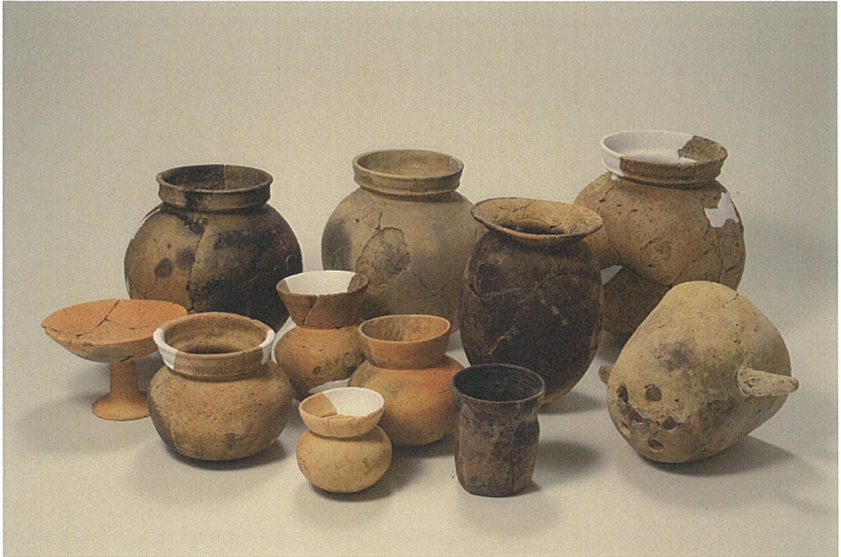
出土完形土器集合