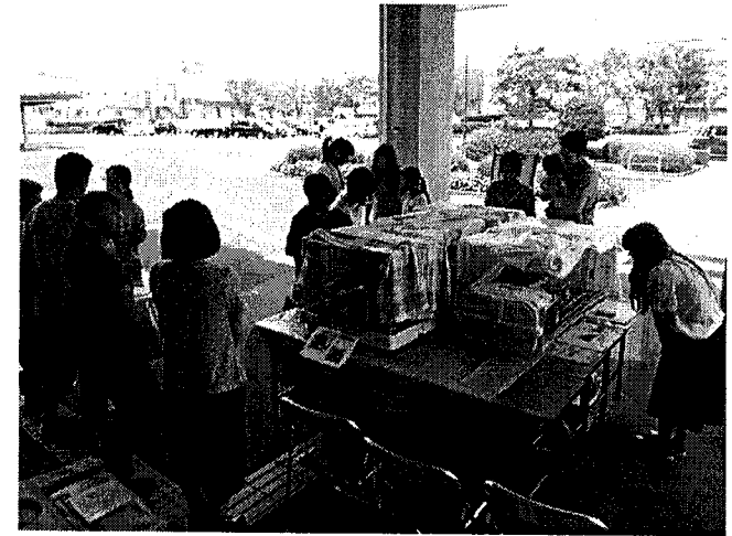
保護動物の譲渡会