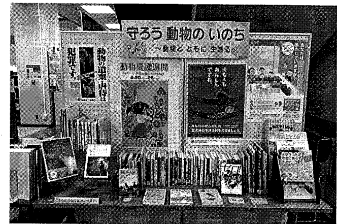
動物愛護普及啓発展示