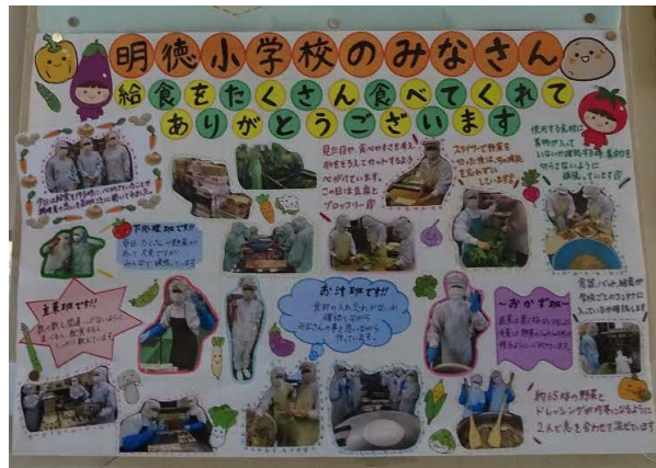
(公財)鳥取市学校給食会 作成