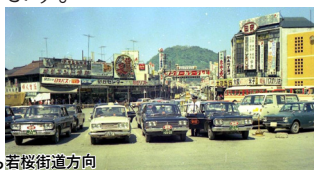
鳥取駅前から若桜街道方向

昭和43年から5年おきに撮影した鳥取県内各所の風景を写真パネルで紹介します。学校周辺や駅前の変化の様子を知ることができます。