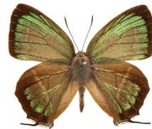
ヒサマツミドリシジミ

鳥取県立博物館で収蔵している鳥取県内で採集された昆虫や、世界の様々な昆虫を展示します。