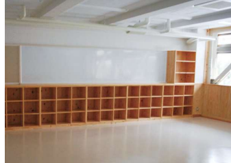
▼温かみある質感が空間を演出する