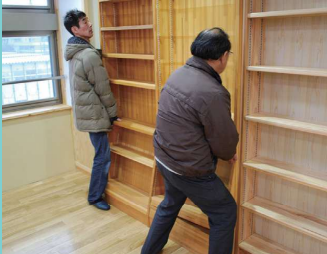
▲微調整を繰り返しながら設置が進む

使いやすさを第一に、ユーザーの視点に立った、ゼロからの設計を心がけているので、お客様の意図を汲み取って具現化していく作業はとても良い経験になります。家具業界においては、杉や桧という木材は木質が柔らかく、製品として流通させていく家具には不向きです。ゆえにシーンやストーリー作りが重要です。ものづくりの技術やノウハウは常に向上しています。あとは県産材のブランド力を全体的に高めていくことにかけていると考えます。