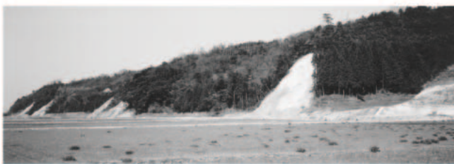
図1 出現した露頭群の一部(2004年4月撮影) 左は白兔, 右は内海中. 左よりNo.1~No.6

露頭の出現した地域は、鳥取市街地の西北西12km、白兔海岸の南方に当たる(図2)。この地域の地質は、1960年頃までは漠然と鮮新世の火山円礫岩(白兔層)と考えられがちであったが、村山ら(1963)は鳥取北部・鳥取南部の図幅調査において、河原火山岩層も複雑に入り組んでいることを明らかにしている。両地層の区分は白兔層が、よく円磨された径20~50cm大の安山