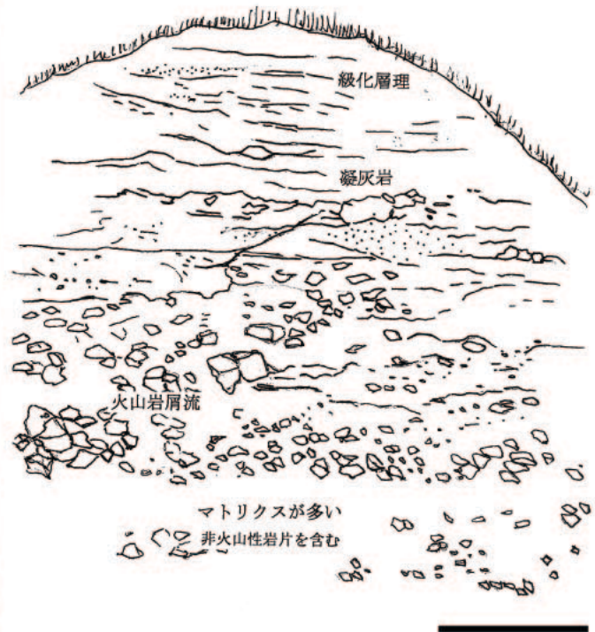
図3 露頭No.4の堆積構造

下部は非火山性の亜円礫も含む，中部は火山角礫，上部は凝灰質泥岩。スケールバーは5m。