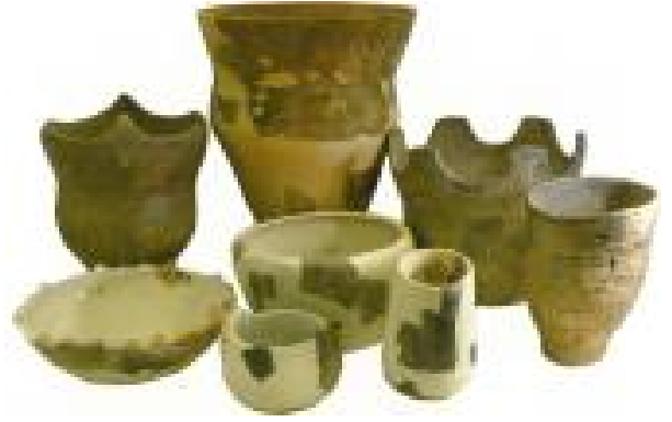
中期末～後期初頭の竪穴住居跡（左）と出土土器（上）