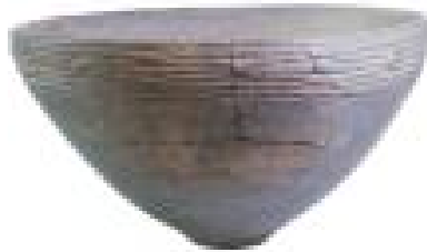
東日本から持ち込まれた晩期の土器