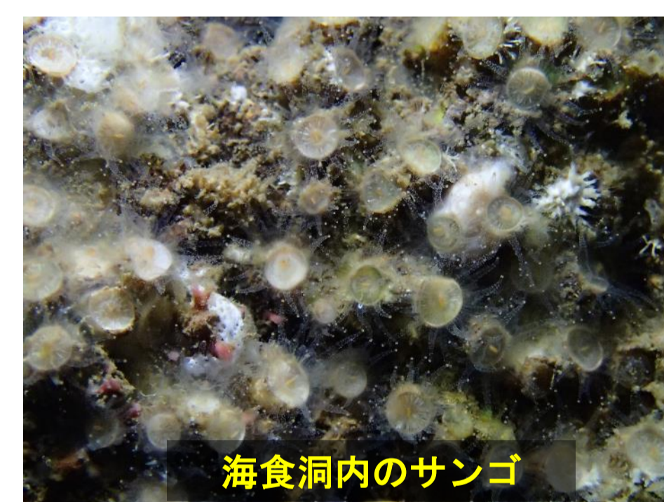
海食洞内のサンゴ