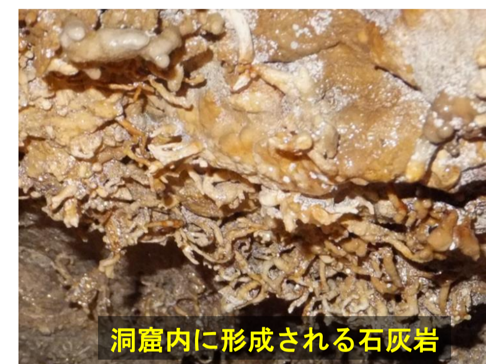
洞窟内に形成される石灰岩