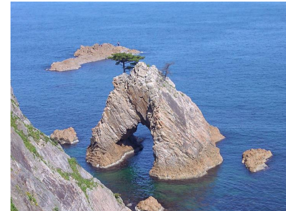
千貫松島（海食洞門）