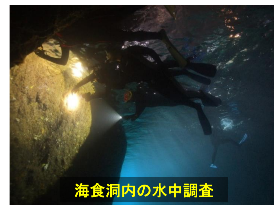
海食洞内の水中調査