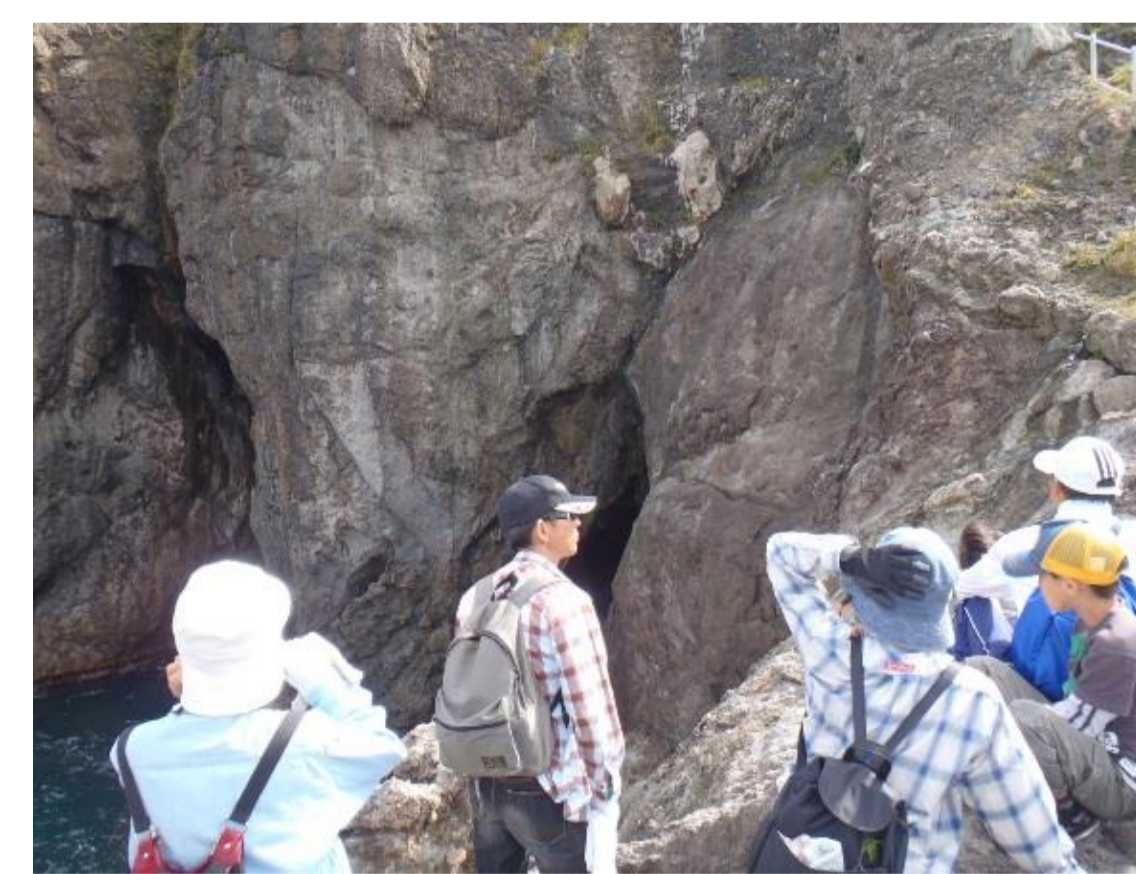
龍神洞のジオツアー