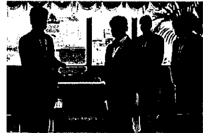
（鳥取県経営者協会への要請）