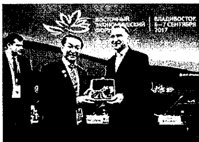
シュヴァロフ・ロシア連邦第一副首相とテーマ別セッションに参加