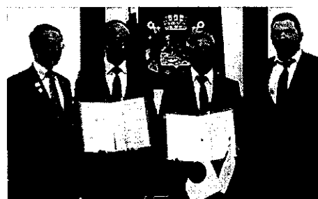
廃棄物処理関連の覚書署名式(9/6)