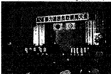
【平成28年の実施状況（鳥取市）】