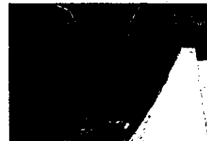
透過型砂防堰堤の新設