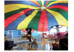
パラ・バルーンを使った学習

しょう ひと なか がっこう しせつ きょういく りょういく う 障がいのある人の中には、学校や施設で「ムーブメント教育(療育)」を受け ている人もいます。これは、パラ・バルーン(直径3mから8mの円形の軽い ぬの)やスカーフなどの遊具を使って運動したり、周りの人たちとのかかわり を楽しんだりする学習です。他の児童や介助者と一緒に行動することで、自 主性、社会性などを育てています。重い障がいがあっても、自分の意思で行 動し、他者とコミュニケーションをとることができることを知ってください。