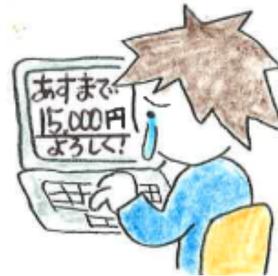
ワンクリック詐欺