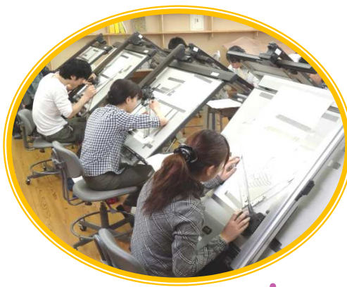
設計・インテリア科