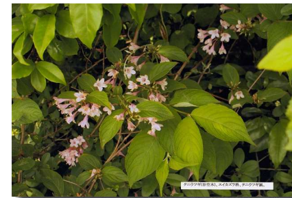
タノキ(樹の木)新芽、クスノキ科、タノキ属、