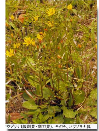
ウコン(顔刺菜・剃刀菜)、キク科、コウゾリナ属