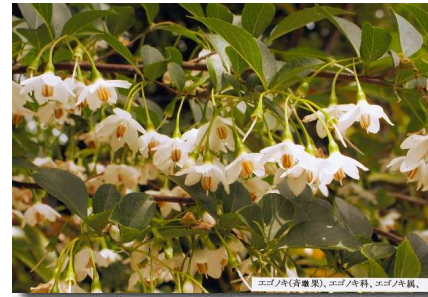
エビナキ(青菫菜)、エゴノキ科、エゴノキ属、