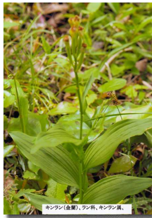
キンラン(金蘭)、ラン科、キンラン属、