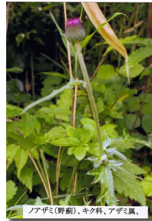
ノアザミ(野薊)、キク科、アザミ属、