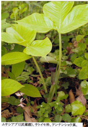
ムシアパパ(武蔵殿)、サトイモ科、テンナンショウ属、