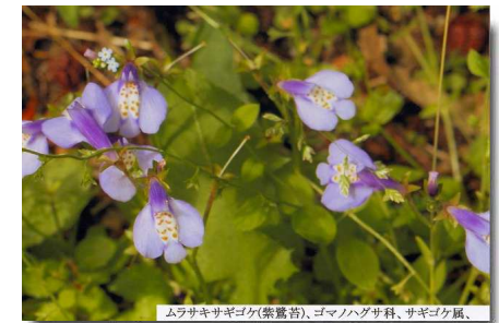
ムラサキ(紫菀)、ゴマノハグサ科、サギゴケ属、

◎ニワセキシウ (庭石菖)、アヤメ科、 ニワセキシウ属、○原産地：北アメリカ。○別名：シシリンチウム・ナンキンアヤメ。○花言葉：繁栄、豊かな感情、豊富。○名前の由来：葉が、サトイモ科ショウブ属の「セキシウ(石菖)」に似ていて、庭によく見られることでの命名です。なを、「石菖」は漢名(日本語読みして「セキシウ」で、「菖蒲(ショウブ)」の別名です。なを、ショウブはアヤメ科のハナショウブとは全く別種です。サトイモ科の植物です。○分布：明治時代に観賞用として、北米から渡来した外来種ですが、現在は各地で野生化しています。花を見た印象はユリ科を思わせませんが、アヤメ科の多年草です。小さな花の花弁は6枚に分かれ、花色は白色と赤紫色が有り、中央部は黄色です。花は受精すると、一日で萎んでしまいます。仲間には、同じ北アメリカ原産のアイロニワセキシウやオオニワセキシウ、キバナニワセキシウが有ります。 ★撮影月日：30, 5, 12、★撮影場所：妻木山区、