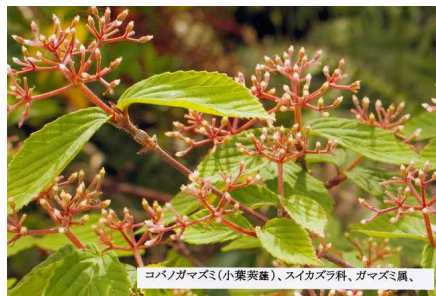
コバノガマズミ(小葉莢蒾)、スイカズラ科、ガマズミ属、