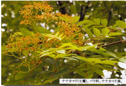
ナナカマド(七竈)、バラ科、ナナカマド属、