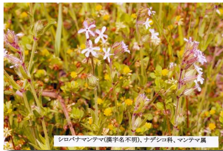
シロバナマンテマ(漢字名不詳、ナデシコ科、マンテマ属)