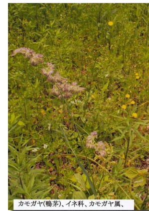
カモガヤ(鴨茅)、イネ科、カモガヤ属、