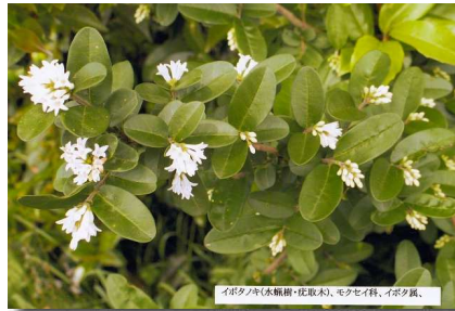
イノシマ(水輪樹・北取木)、モクセイ科、イボク属、