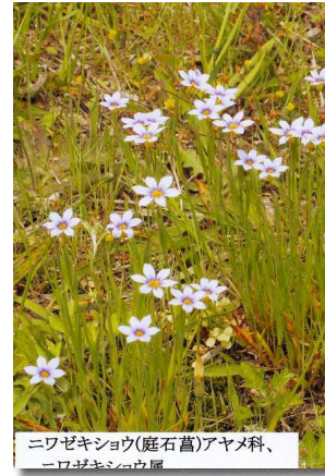
ニワセキシウ(庭石菖)アヤメ科、ニワセキシウ属