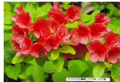
ヤマツツジ(山躑躅)、ツツジ科、ツツジ属、