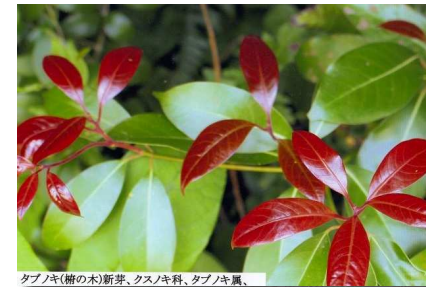
タブノキ(樹の木)新芽、クスノキ科、タブノキ属、