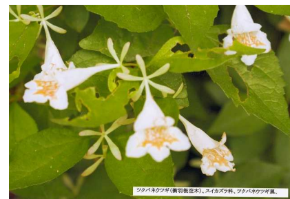
ツタバネウツギ(新田嶺産木)、スイカズラ科、ツタバネウツギ属、