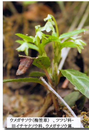
ウメガサソウ(梅笠草)、ツツジ科・旧イチャクソウ科、ウメガサソウ属、