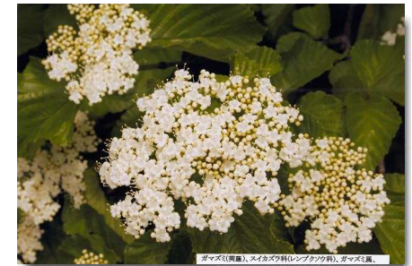
ゴマ(夷蔥)、スイカズラ科(レンブアケボノ科)、ゴマズミ属、