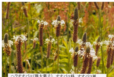
ヘラオオバコ(筒大葉子)、オオバコ科、オオバコ属