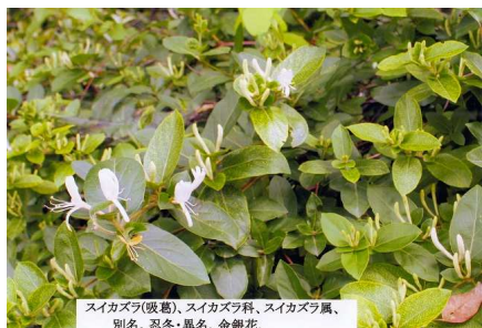
スイカズラ(吸葛)、スイカズラ科、スイカズラ属、別名、忍冬・異名、金銀花