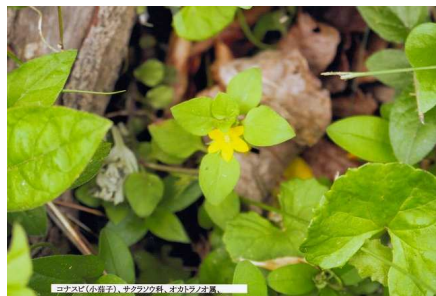
コナスビ(小葉子)、カタラシ科、オカトラノオ属、