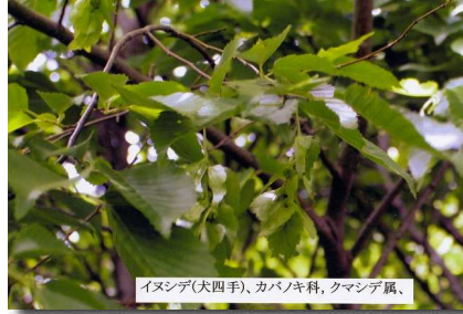
イヌシデ(犬四手)、カバノキ科、クマシデ属、

雌雄同株、雌雄異花 ○別名：シロシデ・ソロ・ソネ。○名前の由来：この仲間は果穂に特徴があり、玉ぐしや注連縄に付ける白い紙を折った「四手」に見立てた。「シデ」は、新芽が赤く美しい「アカシデ」によく似ての異なるので、「似て非なるもの」の「イナ」が「イヌ」に転訛したようです。一般的に「イヌ」は、役に立たない物に使われるとよく云われますが、犬は古い時代から狩猟や牧羊など有用動物であり疑問視されています。○花言葉：装飾。○イヌシデは、山野に普通に生える樹高が20mにもなる落葉高木です。この木は燃えにくいため薪には不向きで、薪炭林には少なかったのですが近年の雑木林では主要な樹種になっています。葉は長さ5cm〜7cmで卵形。葉先は三角形で、側脈はアカシデ(7〜15本)より多い12〜15本です。花は、早春(4〜5月)に咲き、雄花は、カバノキ科らしく猫の尻尾のように黄褐色の穂状に咲きます。花が終わると、大量の雄花序が落下します。雌花は、枝先につき鎌型に反った果苞(葉の様な付属体)の円錐状に付いた果穂を枝にぶら下げます。果苞は外に向かって開いていますが小さいので、あまり目立ちません。○利用：材は硬く、器具、家具材や椎茸原木・薪炭等に利用されています。ただ、非常に硬いので加工が難しいようです。★撮影月日：30, 5, 12、★撮影場所：妻木山区入口遮蔽林(植樹)