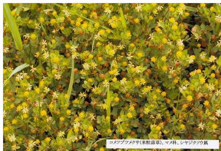
コモンブツメクサ(米粒詰草)、マメ科、シヤジクソウ属