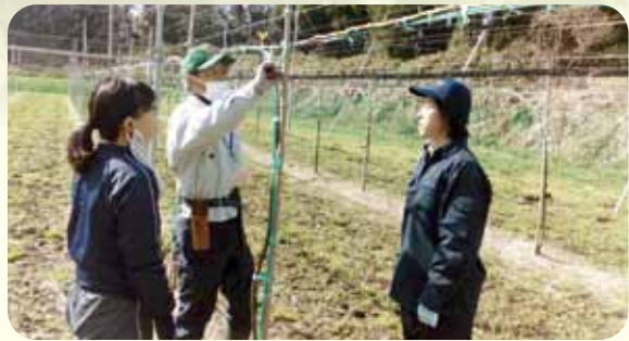
管理担当者の地域おこし協力隊の女性2名と指導中の普及所担当

日野郡の農産物というと、おいしい米、県内最大産地のソバ、高冷地の気候を活かしたトマトやピーマンなど、皆さんよくご存じのことと思います。しかし、こうしてみると日野郡は果樹としては、栗やリンゴ、ブルーベリーが一部地域で栽培されていますが、梨の栽培には全く縁がありませんでした。 こうした中、鳥取県の新しい梨として人気の新甘泉を江府町でも特産にしようと、平成26年に江府町役場を中心に新甘泉プロジェクトがスタートしました。 一般に梨は高度な剪定技術が