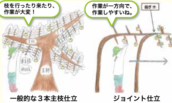
一般的な3本主枝仕立 ジョイント仕立

日野郡の農産物というと、おいしい米、県内最大産地のソバ、高冷地の気候を活かしたトマトやピーマンなど、皆さんよくご存じのことと思います。しかし、こうしてみると日野郡は果樹としては、栗やリンゴ、ブルーベリーが一部地域で栽培されていますが、梨の栽培には全く縁がありませんでした。 こうした中、鳥取県の新しい梨として人気の新甘泉を江府町でも特産にしようと、平成26年に江府町役場を中心に新甘泉プロジェクトがスタートしました。 一般に梨は高度な剪定技術が