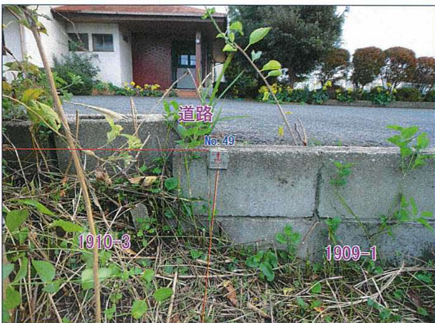
No. 49 標識: プレート