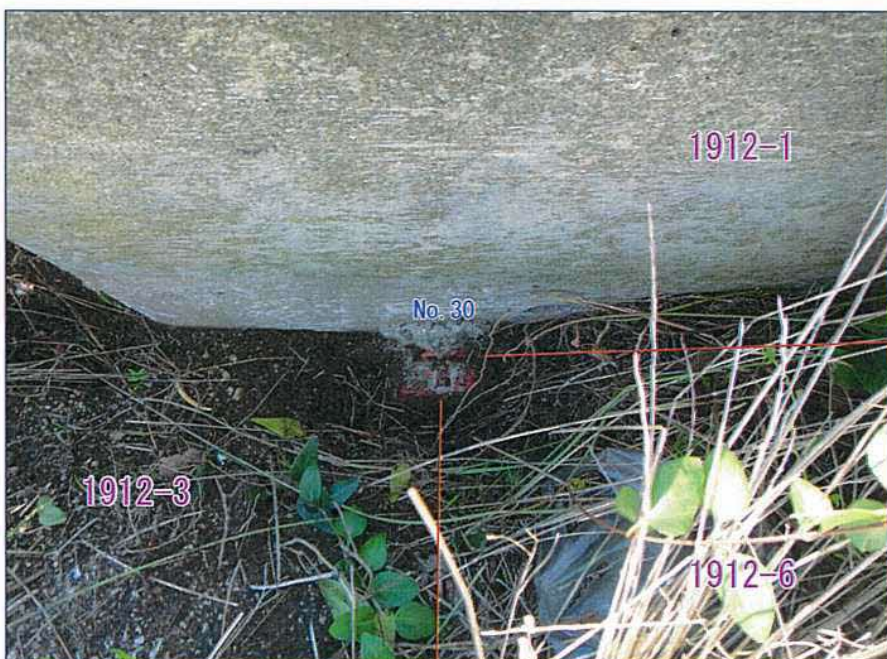
No. 30 標識: コンクリート杭 (既存)