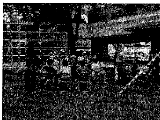
※多くの方が入れ替わり立ち代わり来場