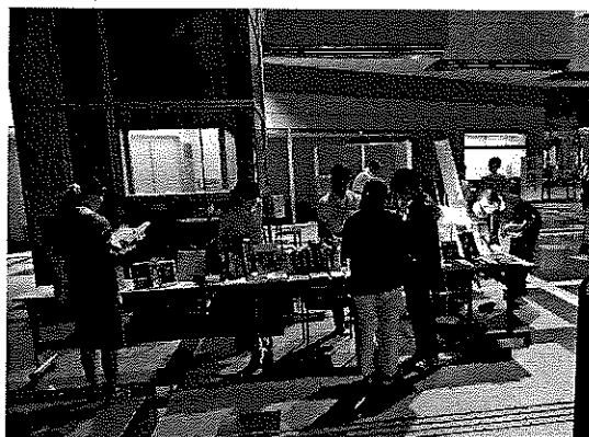
※CD・本など200点を展示・貸出