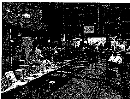
※鳥取サクソフーンクラブによる演奏