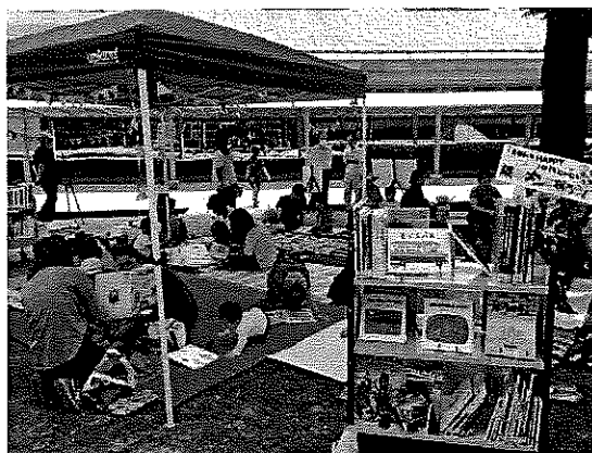
※参加者それぞれで楽しむ時間