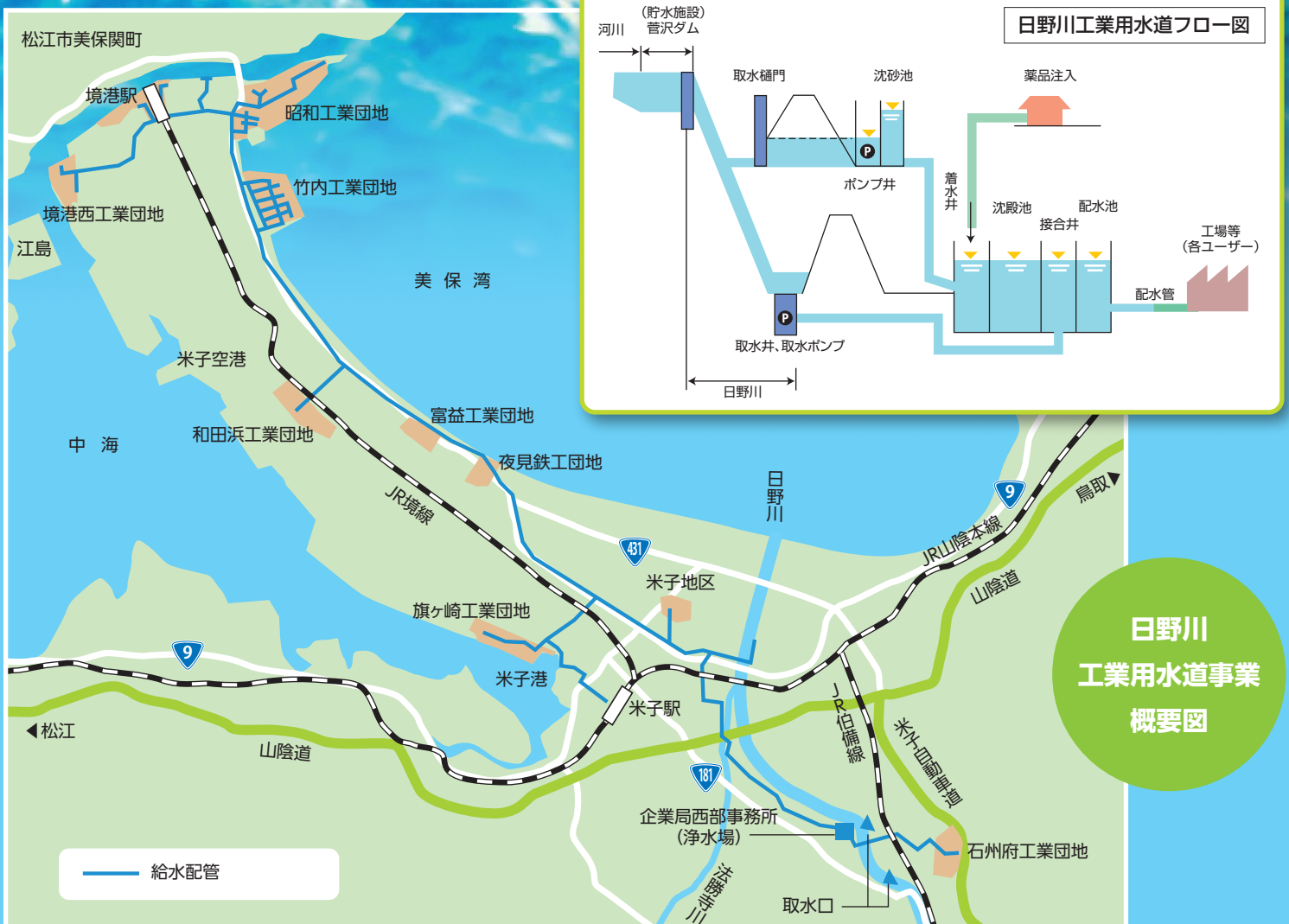
日野川 工業用水道事業 概要図

工業用水の利用を検討される際は、企業局職員がご説明・ご相談に伺います。お気軽にご連絡ください。