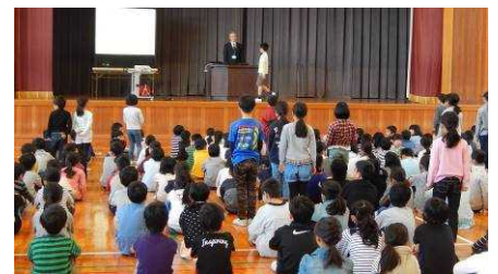
きらりあおぎり全校表彰