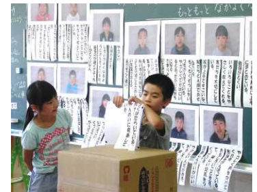
スマイル参観日(授業風景)