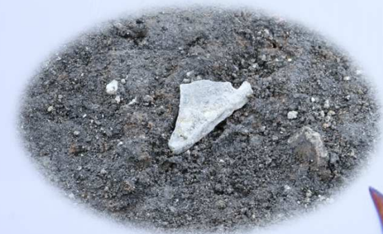
銅戈片出土状況（青谷上寺地遺跡第17次調査）