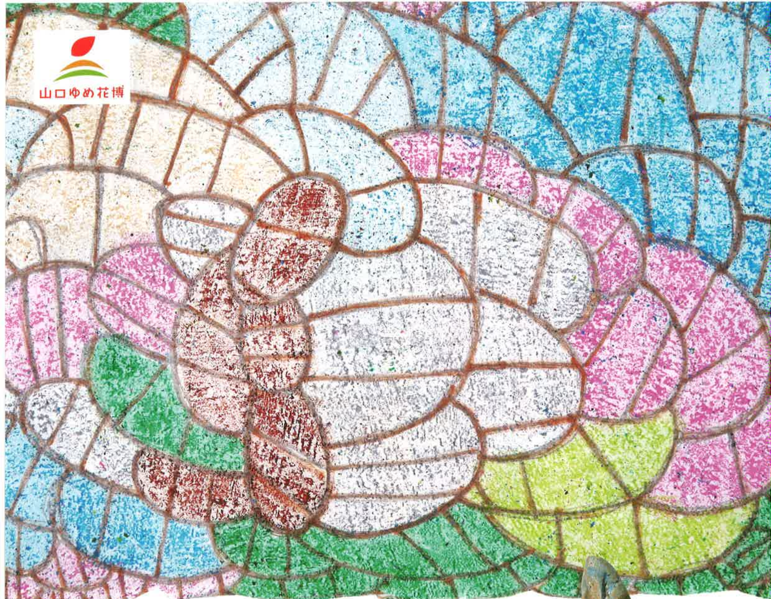
西畑 泰男 『いろは』(部分)