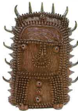
澤田 真一 『無題』