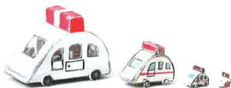
鈴木 勇貴 『救急車』

株式会社Retice、社会福祉法人 愛恵協会、 社会福祉法人 愛成会、社会福祉法人 一羊会/すずかけ絵画クラブ、 社会福祉法人 グローパンパン、社会福祉法人 しがらき会 信楽青年寮、 社会福祉法人 松星苑 第1しょうせい苑、社会福祉法人 ひらきの里、 社会福祉法人 ふあっと、認定NPO法人 高鍋町観光協会、 ポードレス・アートミュージアムNO-MA(社会福祉法人 グロー(GLOW)～生きることが光になる～)