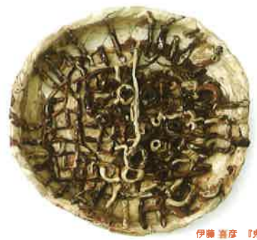
伊藤 喜彦 『鬼の顔』