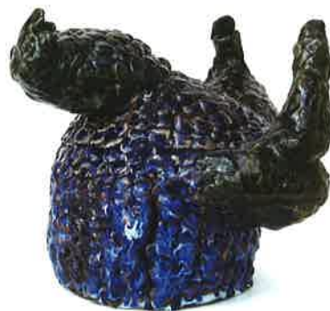
用殿 卓哉 『無題』