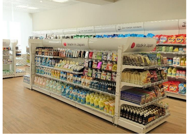
上記写真の場所に陳列し販売します。（ウラジオストク中央郵便局）

※品目によっては、ロシアポストで販売が出来ない場合がございます。また、複数の商品を希望される場合は別途相談をさせていただきます。予めご了承ください。