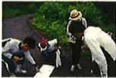
フネル法にて採集