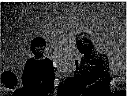
短歌のゲストトーク