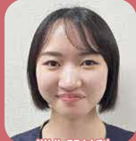
消化器外科 泌尿器科・口腔外科 形成外科

婦人科チームに所属し、手術期や化学療法をされている患者さんの看護を行っています。先輩方はいつも優しく丁寧に指導をして下さり、この1年間で様々な経験を積むことができています。同期とも仲が良く、とても働きやすい職場です。皆さんと一緒に働ける日を楽しみにしています。