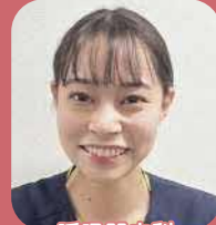
呼吸器内科 リウマチ 膠原病内科

主に周術期の看護を行っています。入社当初は不安もありましたが、先輩方の丁寧な指導のおかげでできる事が増えてきました。忙しい職場ですが、患者さんが元気に退院される姿にやりがいを感じ、前向きな気持ちで日々働いています。皆さんと一緒に働ける日を楽しみにしています。