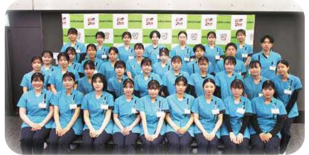
4月から部署配置が決まります