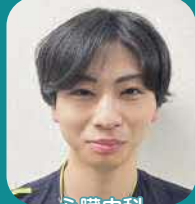
心臓内科 心臓血管外科 呼吸器乳腺・内分泌外科

意識障害や、麻痺などの後遺症を抱え、日常生活の援助が必要な患者さんの看護をしています。患者さんが日々回復されていく姿を間近で見られることに、やりがいを感じています。先輩方に丁寧に指導していただき、できる事も増え喜びを感じながら楽しく働いています。