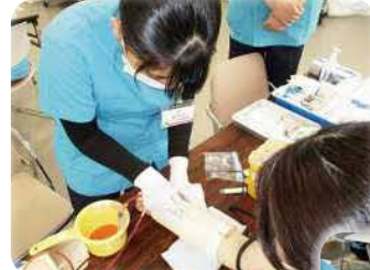
(看護技術研修) 一つずつ丁寧に学べます