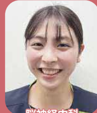
脳神経内科 脳神経外科