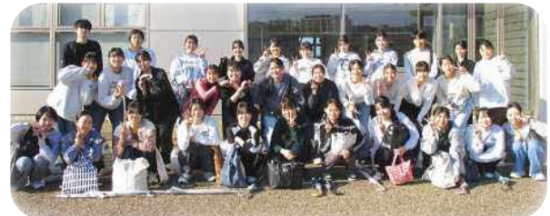
(院外研修) 同期と語り合いリフレッシュします