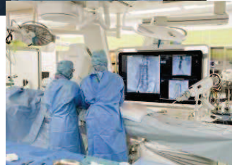
開心術や低侵襲血管内治療を行います