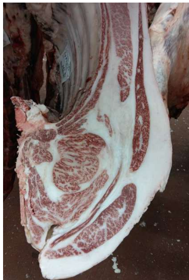
雌(智頭白鵬×勝安波×安福165の9) BMSNo.9, ロース芯 66 cm