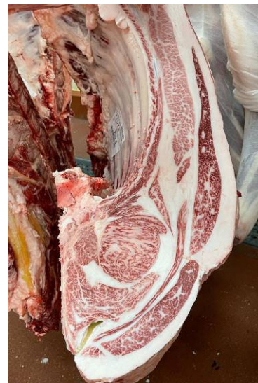
去勢(智頭白鵬×忠富士×福桜(宮崎)) BMSNo.11, ロ-ス芯 77 cm