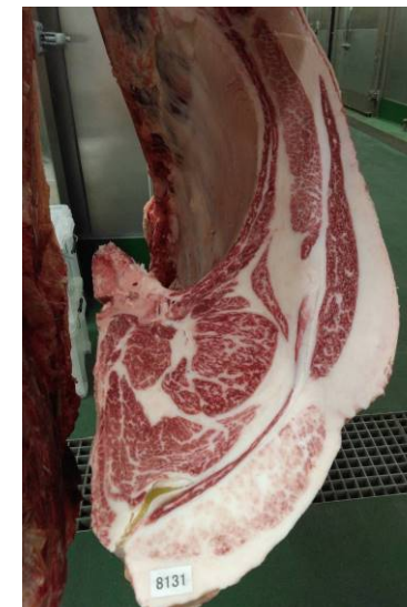
去勢(智頭白鵬×花清国×平茂勝) BMSNo.7, ロ-ス芯 69 cm