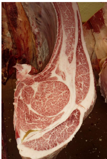
去勢(智頭白鵬×安福久×北国7の8) BMSNo.12, ロース芯 108 cm