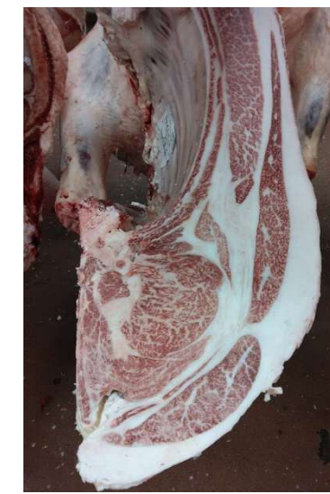
雌(智頭白鵬×美穂国×福桜) BMSNo.11, ロ-ス芯 96 cm