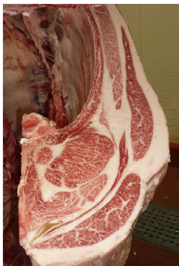
雌(智頭白鵬×光平照×百合白清2) BMSNo.10, ロース芯 73 cm