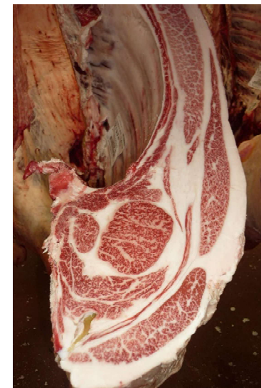
去勢(智頭白鵬×安福久×百合茂) BMSNo.8, ロース芯 70 cm