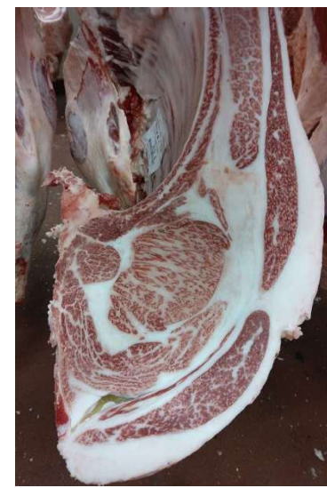
雌(智頭白鵬×花国白清×平茂勝) BMSNo.12, ロ-ス芯 91 cm