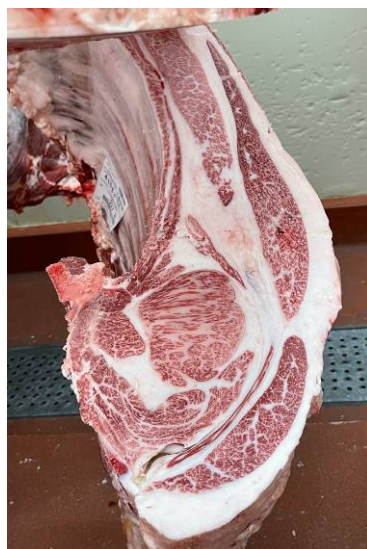
雌(智頭白鵬×平茂晴×平茂勝) BMSNo.11, ロ-ス芯 86 cm