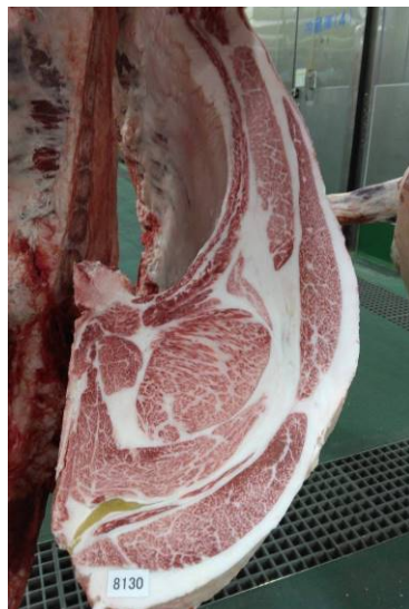
去勢(智頭白鵬×美津照重×安福久) BMSNo.11, ロ-ス芯 101 cm