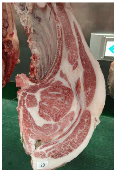
雌(智頭白鵬×光平照×勝安波) BMSNo.12, ロ-ス芯 100 cm