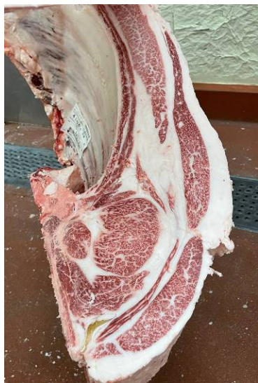
去勢(智頭白鵬×福増×安福久) BMSNo.12, ロ-ス芯 79 cm