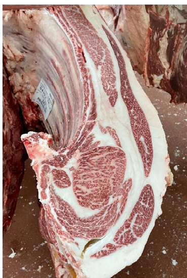
雌(智頭白鵬×耕富士×勝平正) BMSNo.12, ロ-ス芯 90 cm