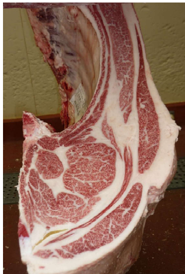
去勢(智頭白鵬×勝安波×北国7の8) BMSNo.12, ロース芯 83 cm