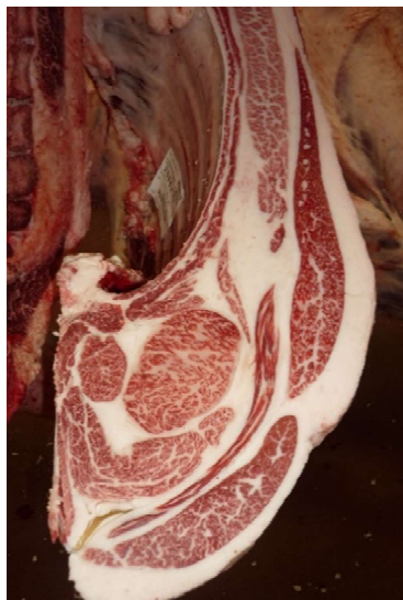
雌(智頭白鵬×寛平茂×福栄) BMSNo.10, ロース芯 68 cm