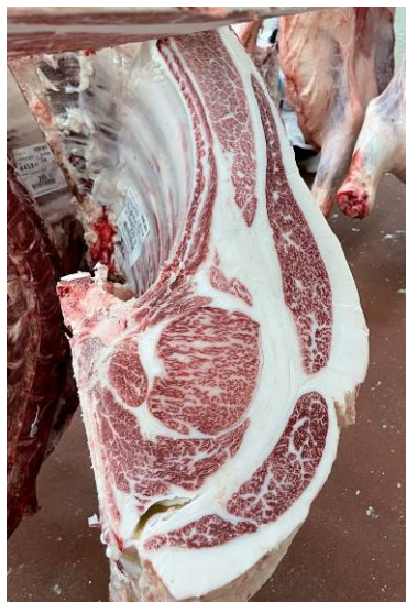
去勢(智頭白鵬×百合白清2×平茂勝) BMSNo.12, ロ-ス芯 100 cm