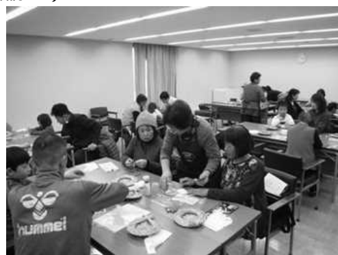
流しびなづくりの様子