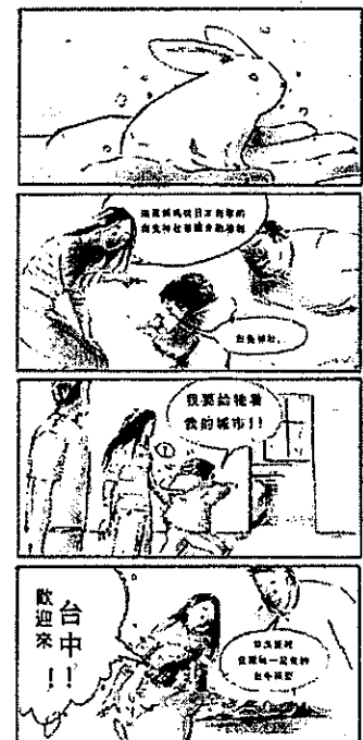
最優秀賞受賞作品「わたしの故郷」

最優秀賞受賞者を、2月23日に米子コンベンションセンターで開催する「第7回まんが王国とっとり国際マンガコンテスト表彰式マンガアワードSHOW」に招待する。