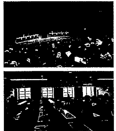
全体説明会(上) 分野別説明会(下)