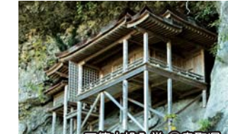
三徳山投入堂