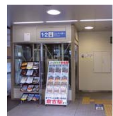
車イスで昇降可能なエレベーター