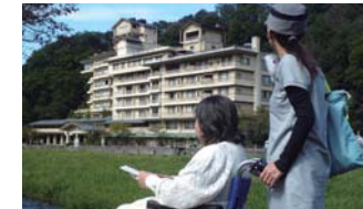
三徳川を眺めながら

国宝「投入堂」で有名な三徳山の麓に沸く三朝温泉は世界屈指のラジウム温泉。お湯が自然治癒力や免疫力を高めてくれるとされ、湯治場としても古くから多くの人に親しまれてきました。昔ながらのまち並みを散策するのも楽しみのひとつです。