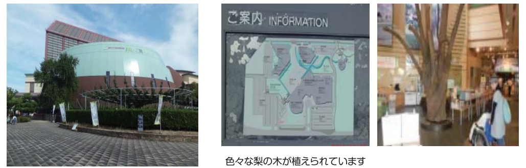
色々な梨の木が植えられています

鳥取県の二十世紀梨は酸味と甘さのバランスがとれた全国でも有名な梨です。なしっこ館では「梨」に関する歴史や産業の紹介、品種について学べます。一年中梨の食べくらべができるコーナーもお見逃しなく。