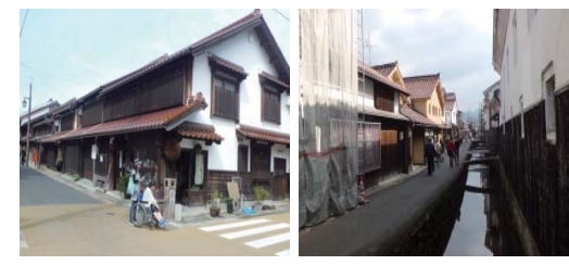
試飲や見学ができる酒蔵 水路と白壁土蔵群 公衆トイレ<バリアフリートイレ>

玉川沿いに並ぶ白壁土蔵群は、今でも当時の面影を残しており、つい時を忘れてのんびりと過ごしたくなる情景です。