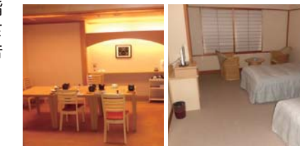
車イス対応食事処 バリアフリールーム

バリアフリールームを備えた旅館・ホテルあり。同室内にトイレ、バス完備で介助者もゆったりと対応できます。お身体の状況やご希望に沿った宿泊施設をご案内いたします。ご相談はトラベルプレス・とっとりまで。