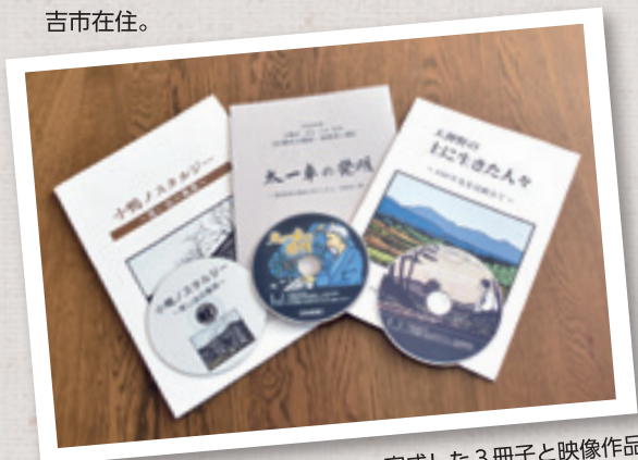
完成した3冊子と映像作品