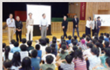
地元小学生の前で映像作品を披露