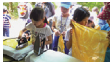
草木染体験の様子