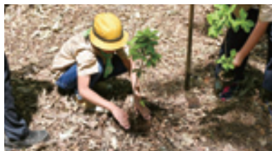
第63回鳥取県植樹祭での参加者植樹