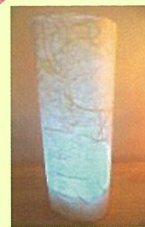
雲竜ランプシェード