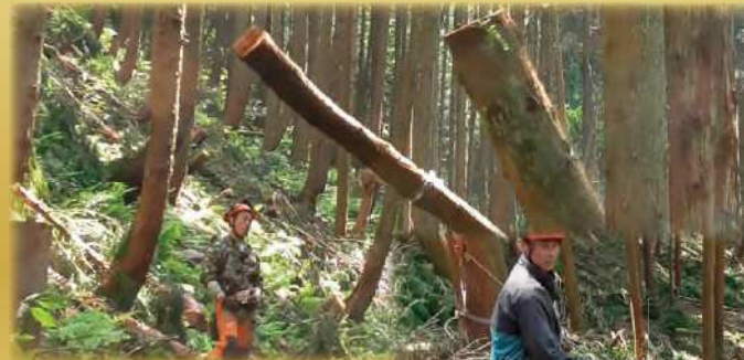
スイングヤーダやタワーヤーダといった架線を使った搬出も行います。搬出した材はハーベスタで造材します。

大変なのは、夏暑く冬寒いこと。他で働いてみないと林業の良さは分からないですね。他の仕事の方が林業より厳しいと思います。