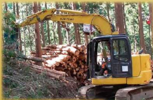
グラブでの集材や土場の整理等も行います。

主に搬出間伐を請け負っています。伐倒、集材、造材など。仕事は指導されて覚えましたが、まだ分からないことが多く、分からないことは聞いています。研修などで他の人の仕事を見ると勉強になりますね。