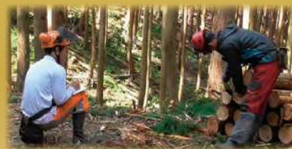
搬出した材は検寸して搬出材積を計算します。運搬は他の業者が行います。