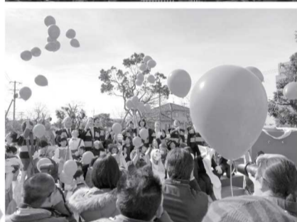
オープニングセレモニーにてバルーンリリースを行う参加者▲