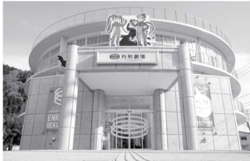
▲くらよしフィギュアミュージアム入り口外観の様子

平成30年4月1日、鳥取県中部の倉吉市に日本最大級のフィギュアの展示施設が誕生しました。その名も「円形劇場くらよしフィギュアミュージアム」。現存する日本最古の円形校舎を保存活用しようと地元有志が立ち上げた会社が