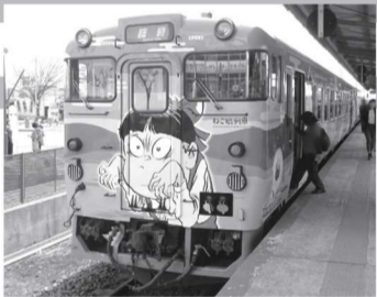
▲新しくなったねこ娘のラッピング列車

ゲゲゲの鬼太郎のキャラクターがデザインされた「鬼太郎列車」が、今年順次リニューアルされています。平成30年3月3日には境港駅前前で「鬼太郎列車」と「ねこ娘列車」のお披露目があり、色鮮やかな新デザインに歓声があがりました。今回のリニューアルでは、鬼太郎のキャラクターだけでなく、山陰の観光資源が背景にあしられ、鬼太郎列車には大山・弓ヶ浜が、ねこ娘列車には宍道湖が描かれています。内部の座席シートにも撮影スポットになるデザインが施され、ますます魅力的な鬼太郎列車から目が離せません!