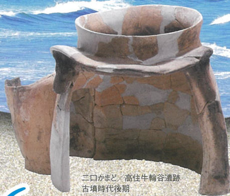
三口かまど／高住牛輪谷遺跡 古墳時代後期