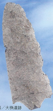
有茎尖頭器／大楠遺跡 縄文時代草創期