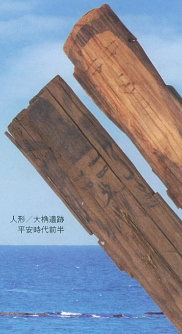
人形／大楠遺跡 平安時代前半