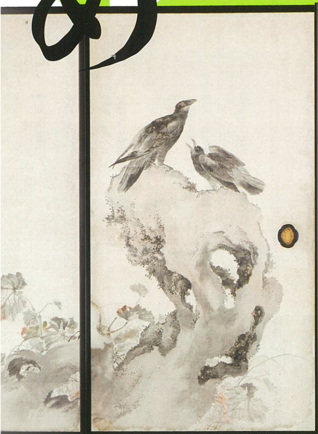
旧興国寺書院障壁画(部分)