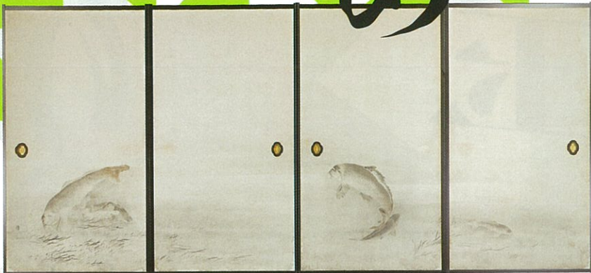
旧興国寺書院障壁画