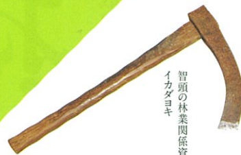
智頭の林業関係資料 イカダヨキ