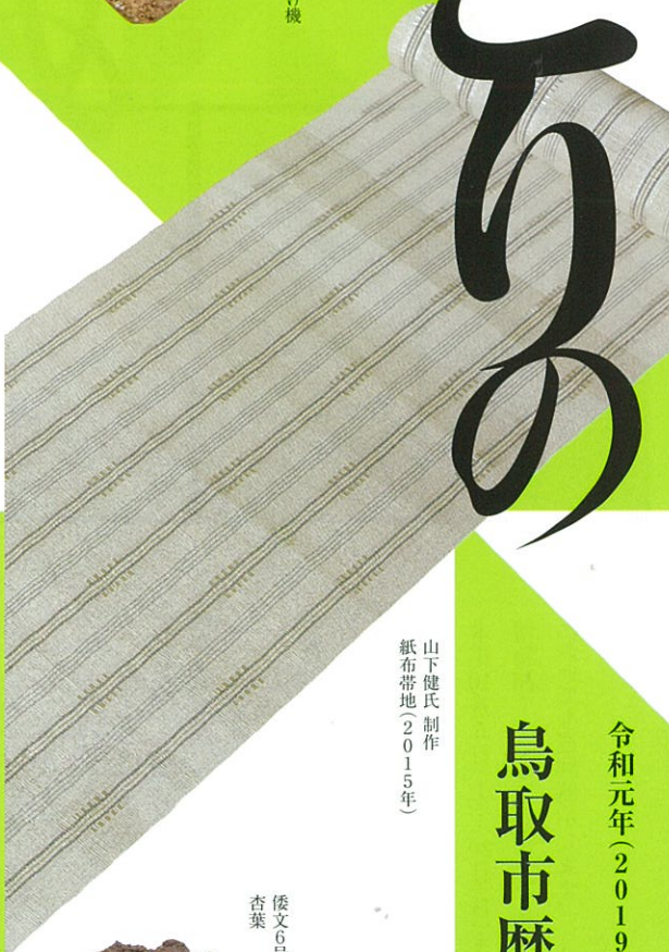
山下健氏制作 紙布帯地(2015年)