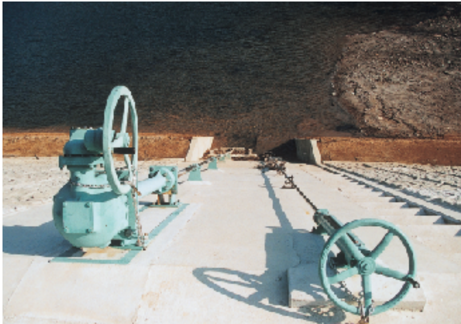
↑ 新しくなった水の取り出し口(斜樋)