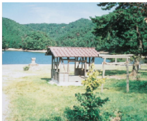
あかまつ だいみょうじん ほくら 赤松池大明神の祠

らたかな赤松池大明神にお参りしたところ、女の子が産まれお初と名づけました。お初は評判の美しい娘になりましたが、松平候の目にとまり妻にほしいと要望されました。藩主の願いはことわれない