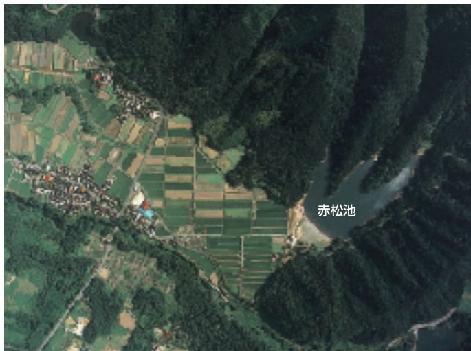
↑ 上空から見た赤松池とその周辺

むかし、松江藩主松平候に仕える松浦頼母という家老がいました。その家老には子どもがなく、日頃から子どもがほしいと願っていました。そこで、靈験あ