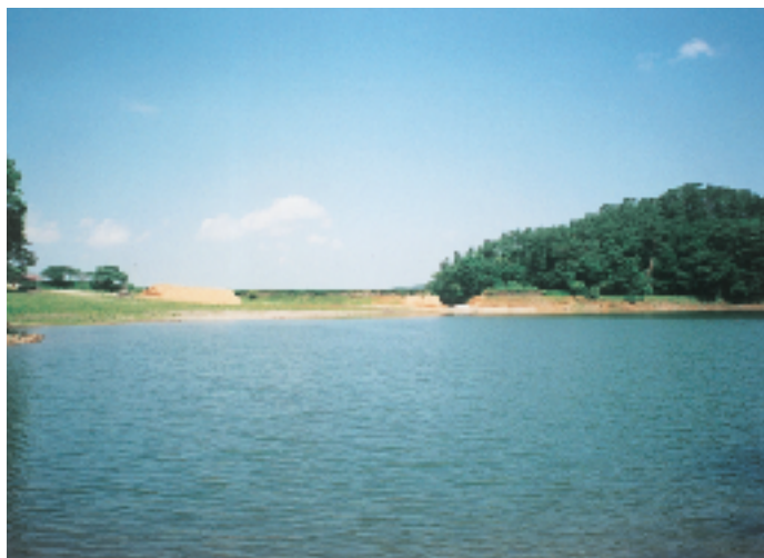
↑ 平成の改修前の赤松池

があったため、トロッコ で運搬して昔ながらのた たき石で突き固めました。 そのため多くの人の力 を必要とし、近くの町や 村から大勢の人が工事に たずさわりました。毎日、