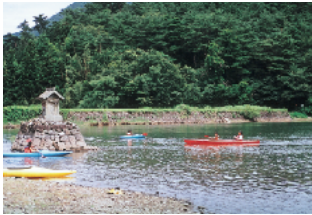
👉 ボート遊びをする子どもたち