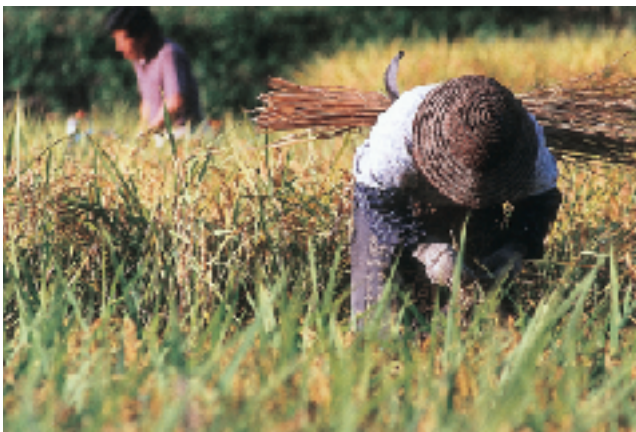
↑ 稲刈りがはじまった水田