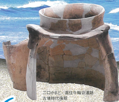
三口かまど / 高住牛輪谷遺跡 古墳時代後期