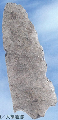
有茎尖頭器 / 大槌遺跡 縄文時代草創期