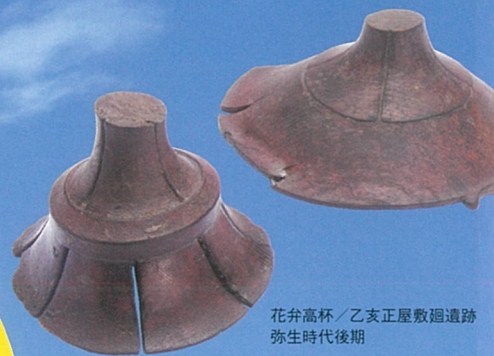
花卉高杯 / 乙支正屋敷遺跡 弥生時代後期