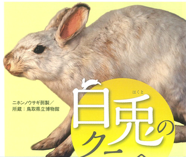
ニホンノウサギ剥製 / 所蔵：鳥取県立博物館

本展では、発掘された新しい因幡の歴史を掘り下げるとともに、その地域的な特性や風土、社会を考えていきます。輝く海と豊かな森、連なる山々、美しい自然の中で育まれた白兎のクニの文化。そのあけぼのを感じてみませんか。