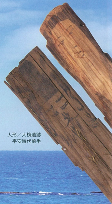
人形 / 大槌遺跡 平安時代前半