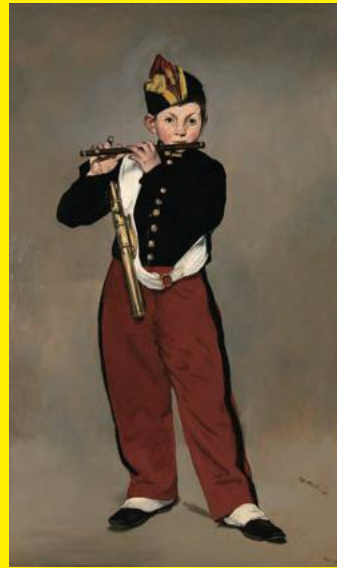
エドゥアール・マネ 《笛を吹く少年・複製》