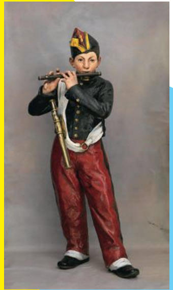
エドゥアール・マネ 《笛を吹く少年・複製》立体再現