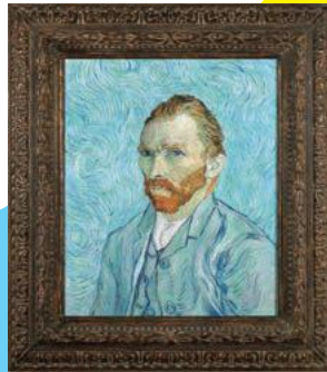
フィンセント・ファン・ゴッホ 《自画像・複製》