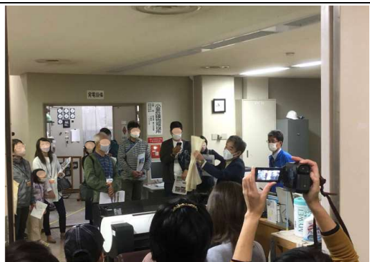
営繕課長による設計説明