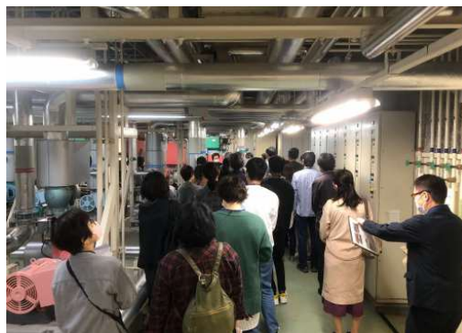
地下空調機械室見学