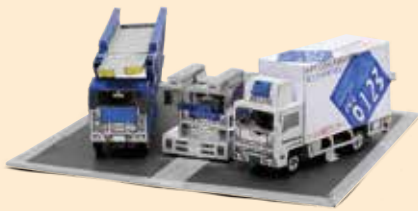
「3台のトラック」松海 英知