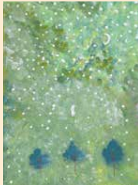
「雪 こんこん」新 三千代