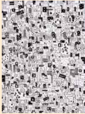
「星が好きな少年」みすてら