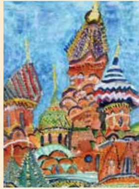
「ヴァシーリー聖堂(ロシア)」森田 慧