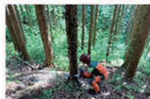
林業アカデミー学生によるチェーンソー 技術の研鑽の様子

チェーンソーの安全かつ正確な操作技術を競う「日本伐木チャンピオンシップin鳥取」(主催 日本伐木チャンピオンシップin鳥取実行委員会)が、本年11月に鳥取市福部町で開催され、日野郡内からも出場者が見込まれています。この大会は安全技術の向上や林業の魅力を広くアピールするために行うもので、これまで2年に一度開催されてきたJLC(日本伐木チャンピオンシップ、これまで青森県で開催)の中間年となる本年、西日本では初めて開催されることとなりました。