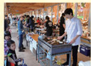
日南町産米を使ったライスパーガー (H29.10.22 にちなんライスパーガーフェス)

にちなん日和のメンバー にちなん日和「第4回にちなんめしふえす」は、今年の10月20日(日)午前10時から道の駅において開催予定です。「まるごと日南を楽しむ」をテーマに、食のブースのほか、白谷工務の寄木南を築き「木のお弁当箱づくり」各種企業によりお仕事体験など、魅力的なイベントが盛りだくさんです。日南町の魅力がいっぱいのイベントに、皆様ぜひお越しください!!