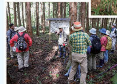
(過去のイベント開催時の様子)