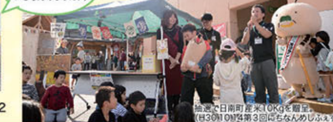
抽選で日南町産米10kgを贈呈 (H30.10.14第3回にちなんめしふえす)