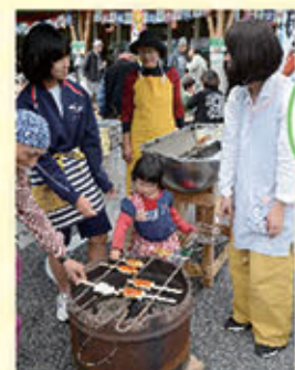
古民家かつみやの 五平餅づくり体験で にぎわう会場 (H30.10.14第3回 にちなんめしふえす)